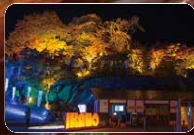
石段街下部やハワイ大國公使別邸周辺も美しくライトアップされます。