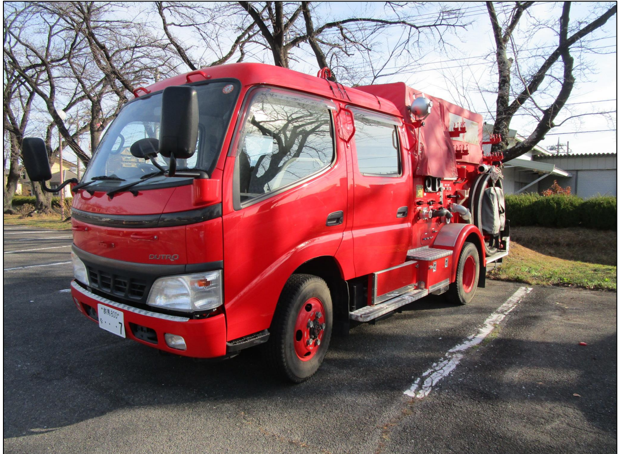
物品番号1 消防ポンプ車