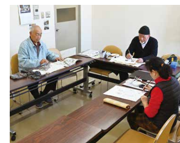
▲題材は各自で選んで制作します

水墨画は、墨の濃淡を使い分け、組み合わせで描きます。遠近感や質感、立体感、色の違いを墨色で豊かに表現できることが奥深く、魅力の一つです。墨色が変わらないよう、塗り始めたら一日で絵を仕上げます。展示は市民総合文化祭、北橘地区文化発表会、行政センターギャラリーで行っています。一緒に楽しく水墨画を学ぶ仲間を募集しています。関心がある人や、地域の人との交流を持ちたい人の参加をお待ちしています。