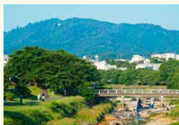
▲浅川から望む高尾山

八王子市は、東京都の南西部に位置し、複数の大学が集まる学園都市の他、高尾山が人気の登山スポットとして有名です。一年を通して混雑している同山ですが、私にとっては自宅の裏山といった感覚で、自転車で坂道を駆け上がり、初日の出を見に行ったことなどが忘れられません。また、市内を流れる浅川は、陣馬山を水源として多摩川へと続く河川で、市民の憩いの場として親しまれています。夕暮れ時の景色も素晴らしく、青春時代の数々の思い出がつまった場所です。