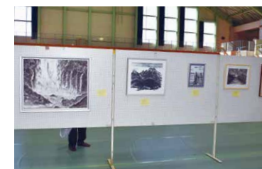
▲11月の市民総合文化祭に出展