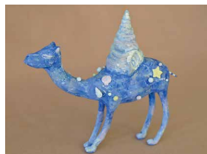
作品名: 想像の生物 種 別: 粘土細工 大きさ: 高さ17cm×幅17cm×奥行5cm