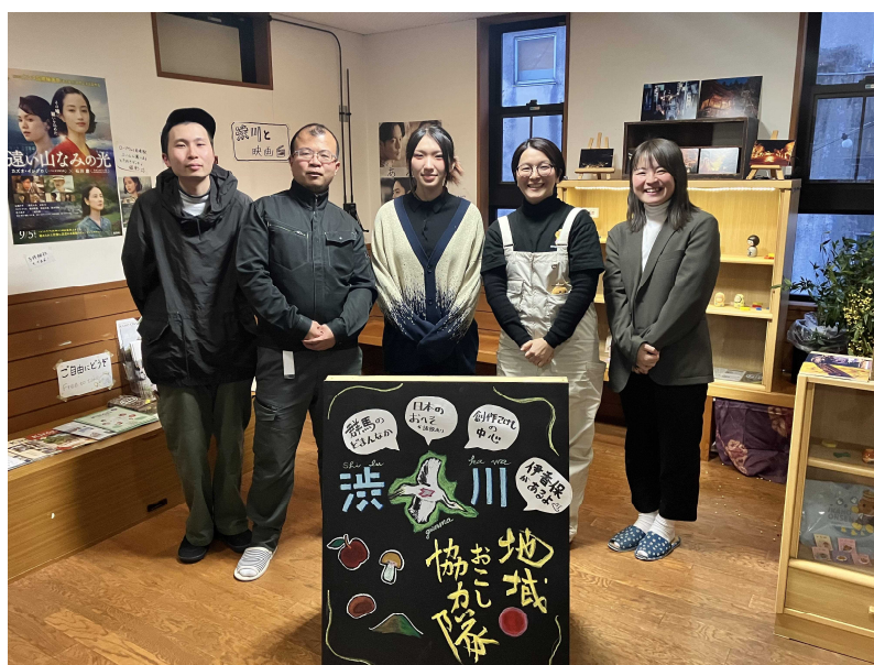
【令和7年度着任中の渋川市地域おこし協力隊】

この指針は、渋川市における隊員の募集から受入体制などをまとめたものです。行政内部で地域おこし協力隊の意義や狙いを共有するとともに、総務省が作成している「地域おこし協力隊取組ハンドブック（令和7年3月）」と併せて活用するものとします。