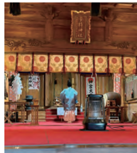
元旦のご祈祷の様子