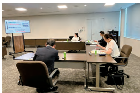
教育福祉常任委員会 行政視察

岐阜市立草湊中学校は多様な学びの選択肢を持つ公立中学校です。年間授業は770時間と負担軽減し、個別最適な学びを可能としています。安心できる大人を自ら選べる仕組みとして、生徒が担任を選ぶ個別担任制を導入しています。一日の状態把握や学び調整の時間も確保されています。また、校内には多様な専