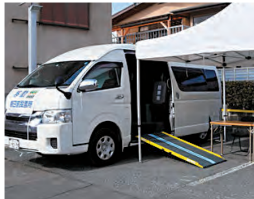
移動期日前投票所の導入を

声、市公式LINE、市公式X、はっとメールでの文字による情報伝達のほか、個別支援プラン登録者には指定支援者による可能な範囲での声かけ等が行われます。