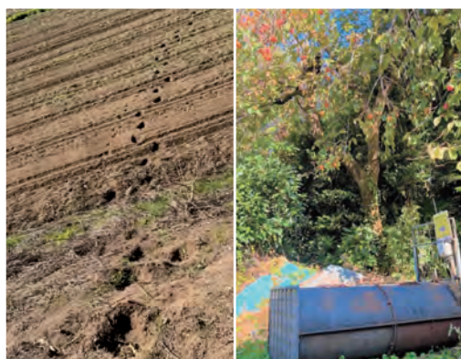
クマの足跡と捕獲のための箱わな

質問 有害鳥獣の駆除に当たるハンター自身の保険加入への見解は。 （市民環境部長） 市から任命された鳥獣被害対策実施隊員は非常勤の公務員としており、任務中の自身