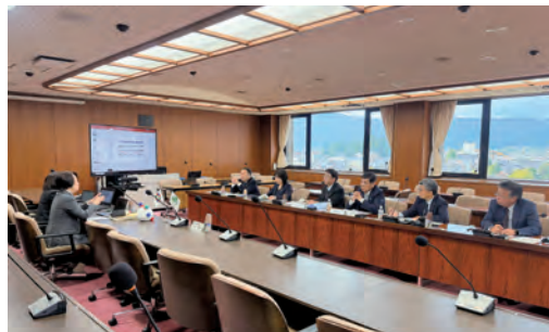
総務市民常任委員会 行政視察

南砺市は、市外転出した女性が戻るための地域づくりを目指し、啓発記事を広報誌に連載し、市民の意識向上を図り、女性向けスキルアップ講座や男女共同参画カルタを活用し、アンコンシャス・バイアスへの気づきを促しています。その結果、「ジェンダーギャップ解消市民会議」の設置や女性活躍を受け入れる地域風土の醸成という具体的な成果につながっていました。 能登半島地震の対応・自主防災組織(小松市) 小松市は、能登半島地震でホテル・旅館に200人超の広域避難者を受入れた経験を生かし、地域防災計