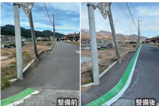
安心安全な通学のために整備されました(中郷地区児童クラブ周辺グリーンベルト)

教育部長 9月定例会では、まずは調査し対応すると答弁申し上げており、実施した対応により、現在雨漏りは止まっています。 それぞれの依存症へのサポート 質問 アルコール依存症からの回復を望む集会(通称A.A)を市内で視察した。多様な依存症に苦しむ市民やその家族のため、広報等の情報提供や群馬県との連携、市の手厚いサポートが必要。見解は。 市長 非常に重要な問題だと思っており、これから改めてしっかりと検討していきたいと考えています。