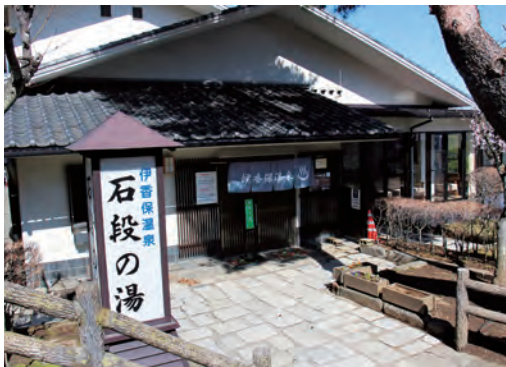
伊香保温泉石段の湯に常勤の責任者の配置を

るには市が補助金を負担する必要がありますかと思ひます。ほかの条件等も確認し、進めたいと考えます。 市長 候補地の補助金の縛りはありますが、できる限り早期に対策が進められるよう、しっかりと取り組んでいきたいと考えています。 質問 住民検診と血中濃度の測定、水源井戸のPFAS汚染の原因究明を国・県へ申し入れすべきでは。 市長 国・県への対応には一定の決まりがあり、動向を見守っていく必要があります。方向性が示されればしっかりと話をしていきます。