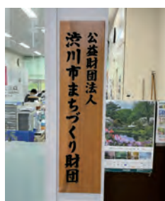
市民会館1階にある まちづくり財団事務所

動や市の主催事業が円滑に行われるよう、公益性の高い運営が求められます。そのため、長年の管理の実績を有し、公益事業の実施を目的とする同財団を指定することが最善と考えました。