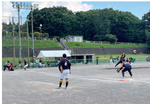
第83回国民スポーツ大会に向けて計画的な会場整備を