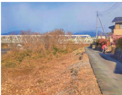
アメリカシロヒトリが発生した河川敷

草の刈り払いには有害鳥獣の潜み場を減らし、出没の抑制につながる取り組みであると認識しています。管理者である県渋川土木事務所へ協力を要請していきます。 質問 児童生徒の登下校時の安全対策として、ツキノワグマが出没する期間は、スクールバスを利用し安全を確保するべきでは。 教育長 多くの課題がありますが、児童生徒の安全確保に向け、地域を限定し一定期間運行できないか、対応について、早急にお答えできるようにしたいと考えています。