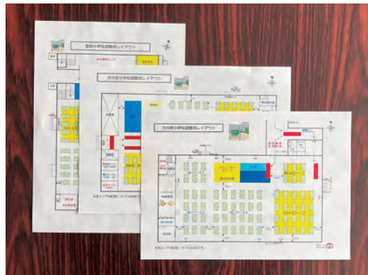
避難所開設・運営訓練のレイアウト図

教育部長 多種多様な情報に触れる機会の提供という観点から令和7年度は小学校8校、中学校2校が新聞を購読しています。