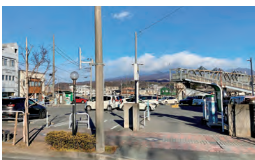
民間に返還される渋川駅前の市営駐車場