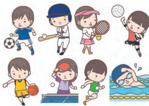
部活動の一元化を望む

するための対策を進めていきます。 質問 小規模な自治会は役員のなり手が不足。市として自治会統合や合併前の区長制度に戻す考えは。