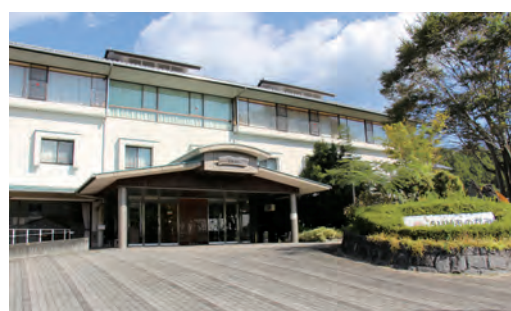
譲渡に向けて協議中の SUN おのがみ

令和7年9月に予定していた施設の無償譲渡の議決と譲渡契約の締結について、譲渡先候補法人と土地所有者との協議に時間を要するため、スケジュール変更の報告と、円滑な協議のため両者の支援を引き続き市が行うとの報告がありました。