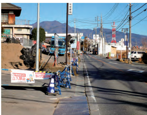
早く広がり 県道高崎渋川線(石原工区)