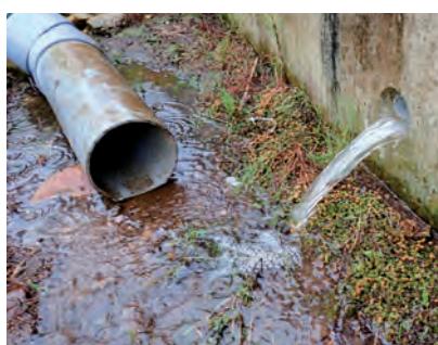
漏水が発生した農業用管路

赤城町持柏木地内の県道と市道に横断埋設されている農業用水路が、劣化と破損により漏水しているため、工事を実施するものです。