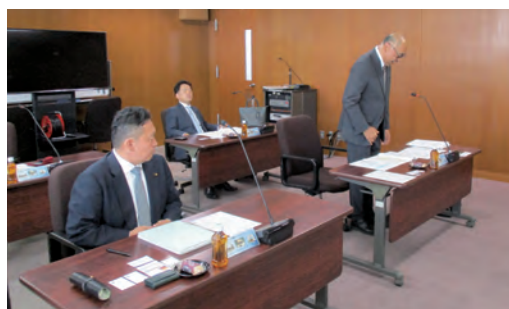
経済建設常任委員会 行政視察

合併20周年を迎えた浜松市は、テレビ放送30周年のアニメ「新世紀エヴァンゲリオン」を活用した誘客促