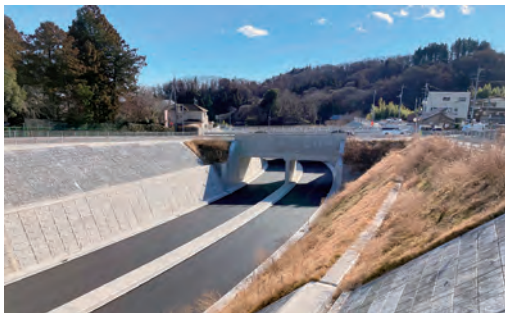
3月末開通予定の渋川西バイパス

令和7年度開通予定の国道17号渋川西バイパスの供用開始に伴う県との管理区間の交換により、主要地方道渋川東吾妻線の一部が県から市に移管されるため、市道として認定するもので、