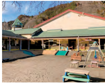
4月から休園となるかに石こども園

来年度の入園希望者がなく、適切な集団規模を確保できず教育・保育環境の維持が困難となるため、休園することが説明されました。