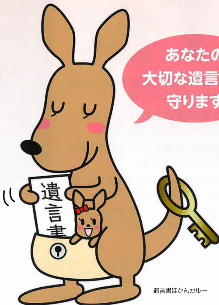
遺言書ほかんガルー