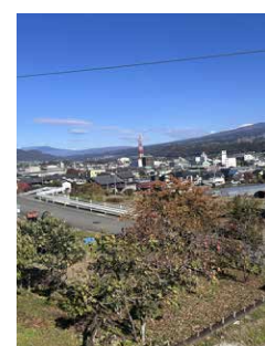
「私の家どこだと思いませんか?」