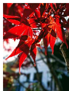
「もみじ饅頭 食べたい」