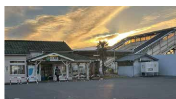
「始発前の煌めき」