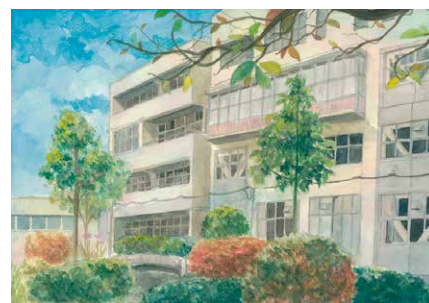
作品名: 変化と永久 種別: 絵画 大きさ: 八つ切り