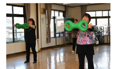
▲ベルを使った体操