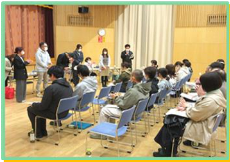
▲子ども会育成会連絡協議会 〈4/10〉

◆各総会では、それぞれ前年度の事業・収支決算報告、今年度の事業計画や方針等について協議しました。