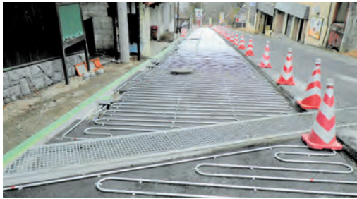
伊香保地区の融雪施設 (ロードヒーター)

答弁 第16分団(水沢地区)は第14分団に統合され、統合後の分団を2部体制とし、旧14分団が第1部、旧16分団が第2部となります。第24分団(上白井地区)は第23