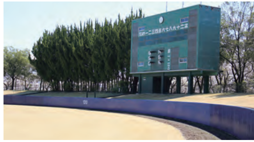
国民スポーツ大会に向けて 順次改修が進む総合公園野球場

ルポール改修、側溝ふた交換を行い、翌年度以降はバックネット支柱やベンチ内の安全対策、スコアボード一部改修、ウォーニングゾーン拡張を予定しています。