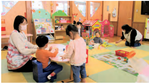
子ども誰でも通園制度が実施されているこもち幼稚園

令和8年3月31日で辞職する委員の後任に千明大志氏を、令和8年5月19日で任期満了となる委員の後任