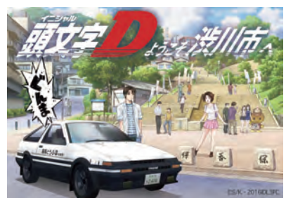
ファンの聖地巡礼が期待されるアニメツーリズム