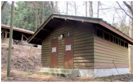
解体せず残すことなどが望まれる旧赤城キャンプ場のトイレ

答弁 旧キャンプ場にある管理棟、シャワー棟、トイレ棟、バンガローなど全施設を解体し、簡易仮設トイレを一基設置します。駐車場は引き続き使用できます。