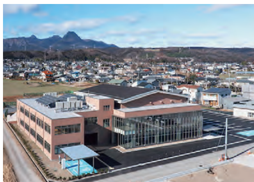
さまざまなサービスが利用でき、南部の拠点として期待される新古巻公民館

市長 公民館を含め職員配置には適正な定員管理が必須で、継続的に安定した行政を目指します。