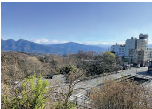
伊香保石段アルウィン公園からの眺め 公園に休憩スペースの設置を

主体に、市の強みを生かした幅広い業種の企業誘致を積極的に進めるとともに企業の経営基盤の安定化支援と人材確保に取り組みます。 観光振興 質問 非常に眺めの良い伊香保石段アルウィン公園に、休憩スペースを設置することはできないか。 産業観光部長 休憩スペースの設置は今後調整していきます。アルウィン公園は、石段街・だんだん広場と隣接し、立地条件の良い公園です。多くの観光客が利用できるよう公園の魅力向上に努めます。