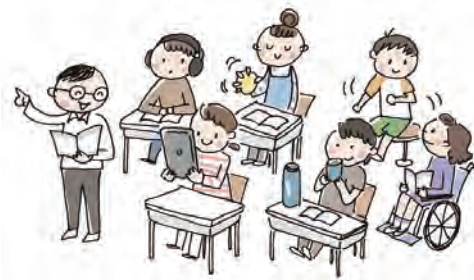
多様な子どもと一緒に学ぶ「インクルーシブ教育」の推進を