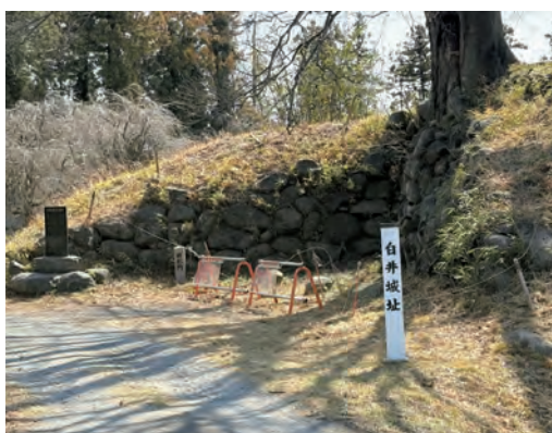
整備が待たれる白井城址