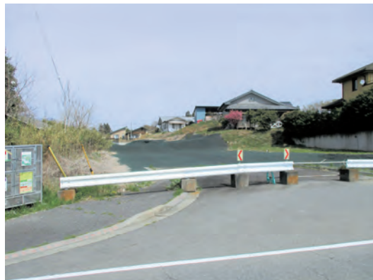
整備が待たれるバイパス道路

質問 赤城町津久田と上白井の間の利根川を渡る橋りょうの整備は合併時の約束だが、現在の状況は。