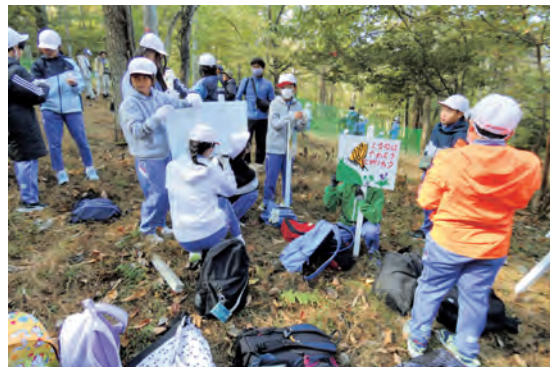
小中学校適正規模・適正配置の後も 地域の特性の尊重を

小中学校適正規模・適正配置で、学校がなくなると地域が寂れてしまうとの、市民から心配する声がある。適正配置後の学校の場所、規模は。校舎等は既存の学校を使うのか、新規に建てるのか。 教育部長 学校施設の老朽化の現状を考慮すると、原則的には既存施設を長寿命化する改修を実施し、利用していくことになると思われ、既存校のいずれかを候補とする検討が主となります。どの施設を利用するのか、利用する場合いつ改修を行うのか、それ以外とするのか、早期に検討を進めていきます。 スラグ対応は毅然とした対応を