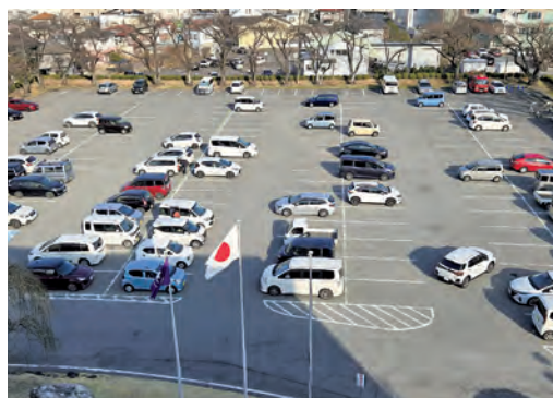
新庁舎の検討に向け調査が行われる本庁舎駐車場

最も古い。建て替えや耐震化は。 教育部長 古巻公民館整備事業が完了した後に、具体的な整備方針の検討を進めたいと考えています。 質問 市役所新庁舎との複合化は。 教育長 市長部局と連携し、検討を行いたいと考えています。 質問 現公民館の事務室は、各種相談や受付をする場でもあるがスペースが狭い。講堂も使い勝手が悪く、いずれも改良工事が必要と思うが、考えを伺う。 教育部長 耐震化や建て替え等の考え方も含めて検討を行います。