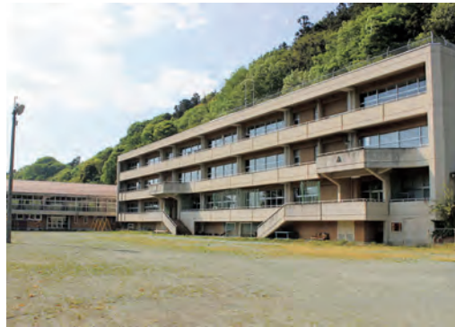
背後の斜面のために利活用ができない旧南雲小学校

を児童生徒に知ってもらうため給食に取り入れており、今後も栄養価を考えながら提供していきます。