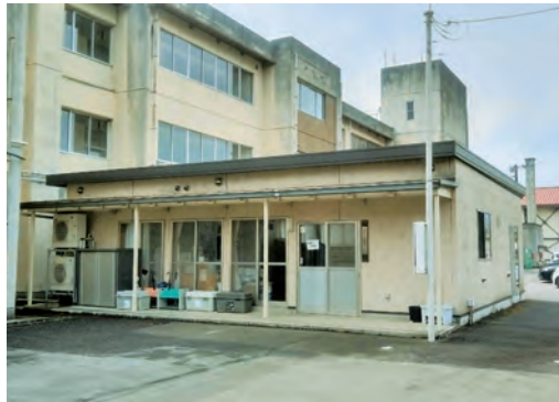
Wi-Fi環境の整備が待たれる放課後児童クラブ

質問 八崎・分郷八崎地内の旧渋川大胡線はどのような調査を行い、安全性確保を確認しているか。