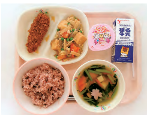
みんなで食べるおいしい給食

総務部長 バリアフリー化していない投票所では、係員の人的介助により対応しています。また、点字で作成した候補者等の氏名掲示は、全投票所に配置しています。