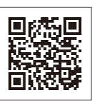
▲ハローワーク渋川の公式LINEはこちら

ID 11286 労働保険の年度更新手続き 申告関係書類は、厚生労働省から5月下旬に各事業主へ送付されます。7月10日(金)までに申告・納付手続きを完了してください。 申請方法 書面またはインターネット「e-Govサイト」を経由した電子申請 問合せ先 群馬労働局(☎027(896)4734)または商工課(☎22596)