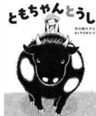
「ともちゃんとうし」