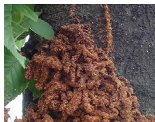
▲被害樹木にたまったフラス

▷被害を受ける木は、サクラ、ウメ、モモ(ハナモモ)などのバラの仲間の木 ▷かりんとう状のフラス(木くずとふんが混ざったもの)が、木の幹や枝の間、根元にたまる ▷フラスがよく見られる時期は5～9月ごろ