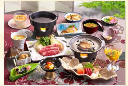
(料理の写真は一例です)

宿泊利用はもちろん、日帰り入浴も可能です。黄金の湯と白銀の湯、どちらの温泉にも入れますので、ぜひ、お越しください。