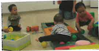
5月21日 研修室で3組が参加された「自由遊びの時間。」

木曜日の少し大きな赤ちゃんの日では、スキンシップがとれるように、親子ふれあい遊びを取り入れて、毎回親子で楽しんでいきます。抱っこして、みみめあって、話しかけることで、子どもは、「自分が大切にされている」と感じるそうです。ふれあい事で「オキシトシン」という親子互いのホルモンがでてくるそうです。