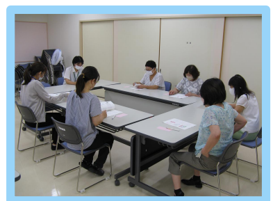
ライフスタイル別の食育に ついて講義を行います！