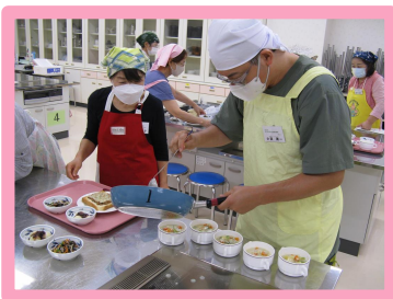
ライフスタイル別に異なる テーマで調理実習を行います！