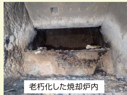
老朽化した焼却炉内

この工事は、毎年行っている補修工事とは異なり、ごみ焼却施設内の主要機器を対象とした大規模な改修工事です。施設の寿命を15年以上延ばし、今後も安定してごみ処理を行えることを目的として実施します。