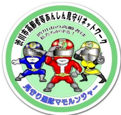
ステッカーのイメージ (直径9cm)

見守り活動がスムーズになるよう店舗用ステッカー、活動者用カード及び説明用パンフレット (別紙) をお配りしています。